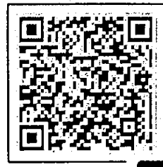
PAY by square